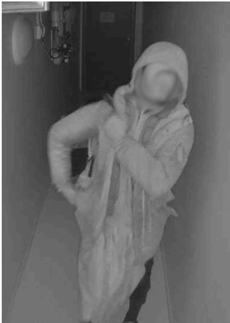
Bilden är maskad

Den här mannen släpptes in i fastigheten av en boende i mitten av februari. Han preparerade en av dörrarna på plan 2 för att kunna röra sig fritt i fastigheten. Han använde huset till att både förvara narkotika och använda den som toalett.