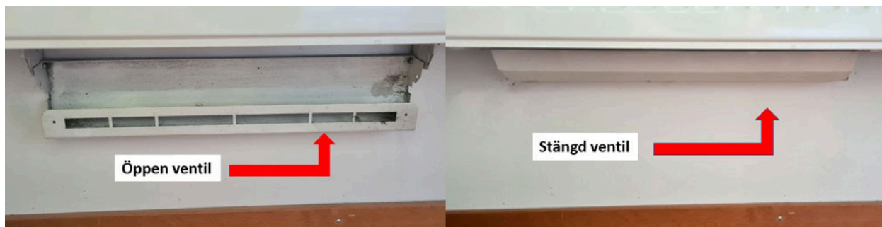
Bilderna illustrerar en öppen och en stängd ventil

Ventilerna sitter under dina större element.