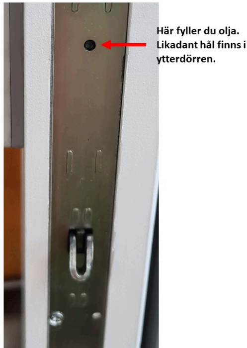
Bild på balkonglåset

En bra olja finns att köpa hos låssmeder. En välinvesterad kostnad eftersom oljan räcker i många år.